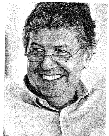
Die RTL Group unter Gerhard Zeiler kämpft in Osteuropa mit sinkenden Umsätzen. Problemmärkte sind Ungarn, Kroatien und Russland

weitaus pessimistischer. Bei der RTL Group, die in Ungarn, Kroatien und in Russland tätig ist, und bei der ProSiebenSat.1-Gruppe, die in Ungarn, Rumänien und Bulgarien operiert, liegt der Anteil des Osteuropageschäfts unter fünf Prozent des Umsatzes. Bei der amerikanischen CME, die ausschließlich in Mittel- und Osteuropa tätig ist, aber auch bei der schwedischen MTG, die 18 Prozent ihres Umsatzes in Mittel- und Osteuropa erwirtschaftet,